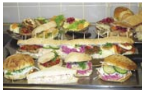
Et udvalg af de sandwichboller der sælges på skolerne. En sandwichbolle udgør ernæringsmæssigt et fuldt dækkende måltid. Og de smager ret godt og mætter dejligt længe...

Alt i alt koster det ikke flere penge at blive mæt i skoleboden nu i forhold til tidligere. Priserne i skoleboderne er blevet ændret, fordi eleverne nu kan købe fuldt dækkende måltider. Det kunne de ikke tidligere. Maden i skoleboderne er blevet kortlagt og analyseret i februar 2002, og det viste sig, at eleverne skulle købe flere sandwiches, toast, frikadeller og salater, hvis de skulle have deres energibehov dækket, og det kostede flere steder 20-30 kr. I dag koster dagens varme ret 18 kr. og en stor sandwich, der udgør et helt måltid, koster 15 kr. En halv portion varm mad koster 10 kr. og en lille sandwich koster 10 kr. Derudover kan eleverne købe brød, frugt og grønt i løssalg.