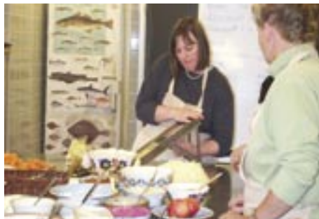
Kantinelederne fra 8 skoler var på kursus 12 uger i foråret 2002 hos Økologisk Oplysnings Forbund. Kurset var en del af omlægningen af kantinerne og det handlede om børn, økologi og ernæring.

Succesen for Det Gode Måltid afhænger af, om vi kan udkonkurrere grillbaren, bageren, supermarkedet og de dårlige madpakker. Samtidig er vi ved at udvikle en model for, hvordan vi kan afskaffe madpakkerne for de 1500 børnehavebørn, der i dag har madpakker med, fordi der ikke er køkkenfaciliteter og køkkenpersonale til at lave mad til dem i institutionen.