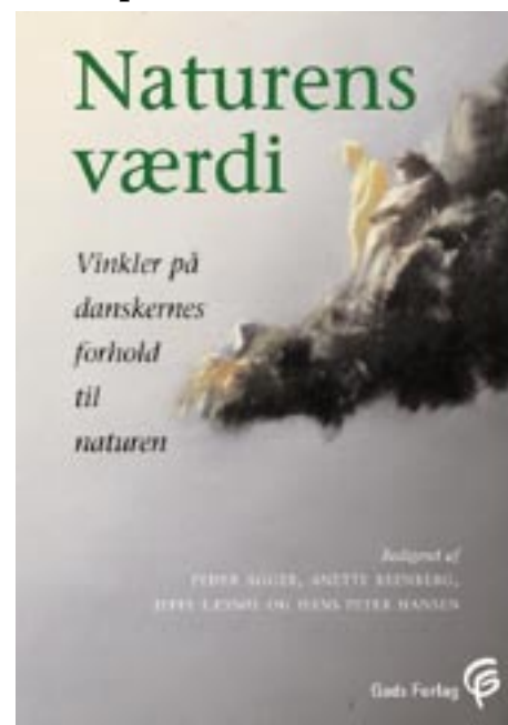
Maleri af Povl Anker Bech - Forårshav, 1998

Læs om MUSIK OG BÆREDYGTIGHED på side 2 og 3: